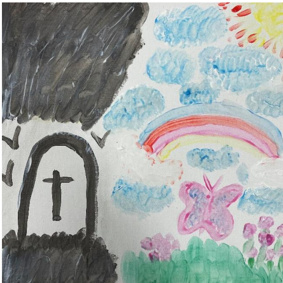
Schilderij linkwerker 3

Het bespreken van de schilderijen leidt tot inzage in gezinscasussen die de linkwerkers als leuk of juist verdrietig hebben ervaren. Bovenstaand schilderij geeft een verdrietige thuissituatie weer van een gezin van linkwerker 3. In onderstaand vignet staat omschreven hoe zij de begeleiding in deze case heeft vormgegeven.